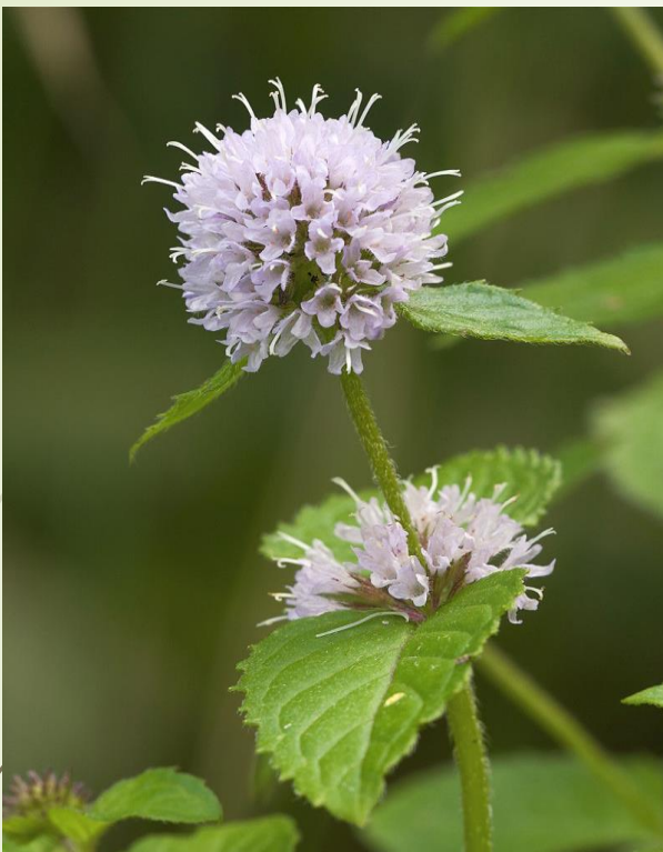
Mięta, np. nadwodna