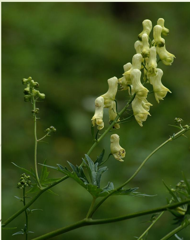
Tojad żółty [tojad lisi]