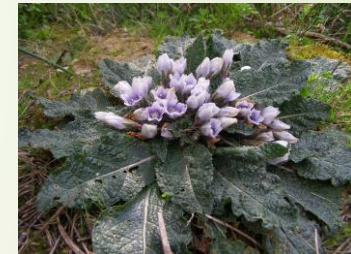
Mandagora lekarska [ Mandragora officinarum L. ]

Z pewnością pamiętasz lekcje przesadzania krzyczącej magdragory u prof. Sprout? Musisz wiedzieć, że madragora nie jest rośliną zmyśloną, lecz prawdziwą! Mandragora lekarska ( Mandragora officinarum L. ). rośnie w basenie Morza Śródziemnego i zaliczana jest do rodziny psiankowatych, podobnie jak nasz pomidor, czy ziemniak.